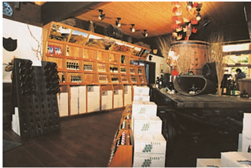
Weinverkauf in der Vinothek

Besuchen Sie uns in Durbach – Sie sind jederzeit herzlich willkommen.