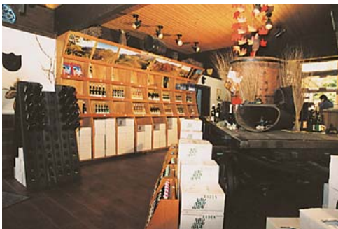
Weinverkauf in der Vinothek

Besuchen Sie uns in Durbach – Sie sind jederzeit herzlich willkommen.